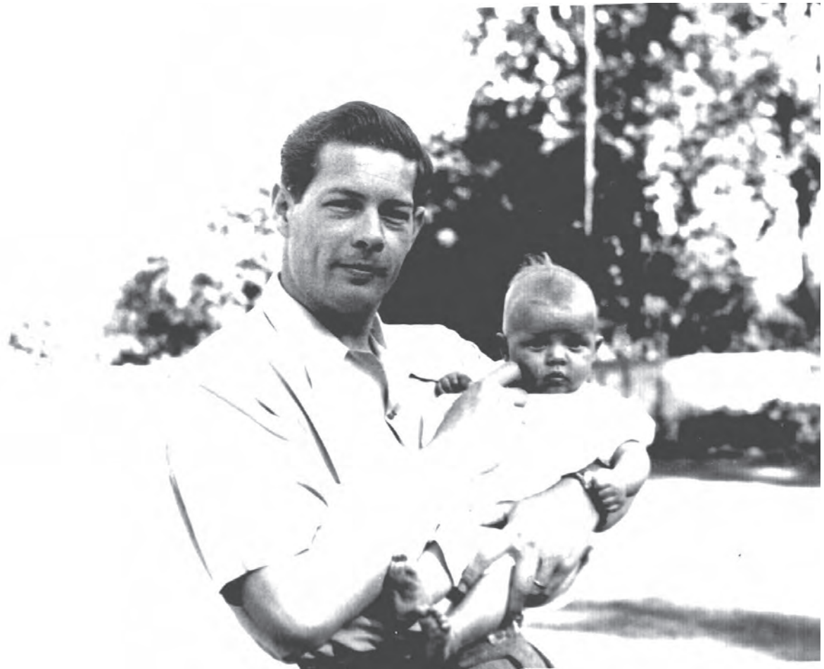
Principesa Moștenitoare și Regele Mihai, 1949