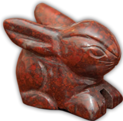
Miniatură din piatră din colecția Principesei Moștenitoare