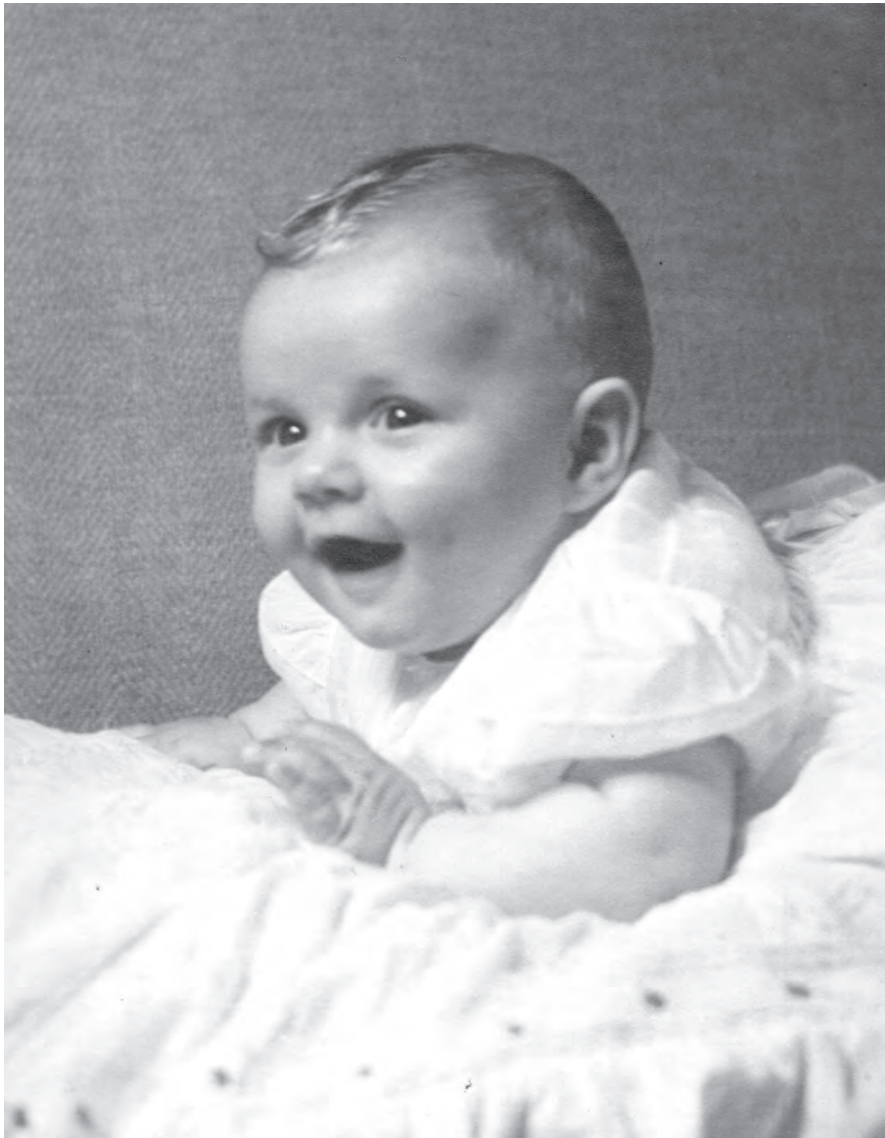
Una dintre primele fotografii ale Principesei Moștenitoare, 1949