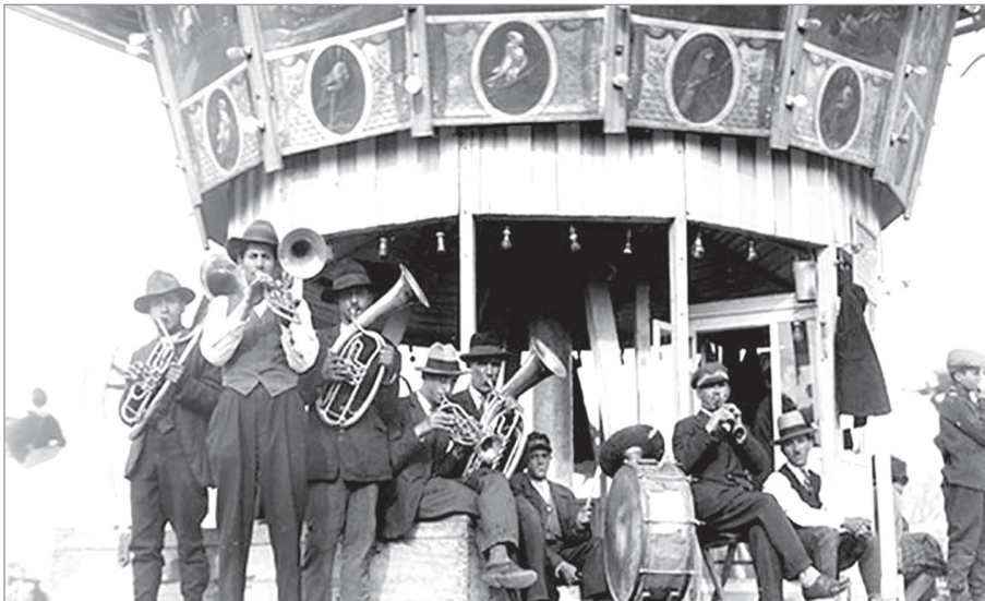
Caruselul și fanfara, distracții populare de succes la Târgul de Moși.