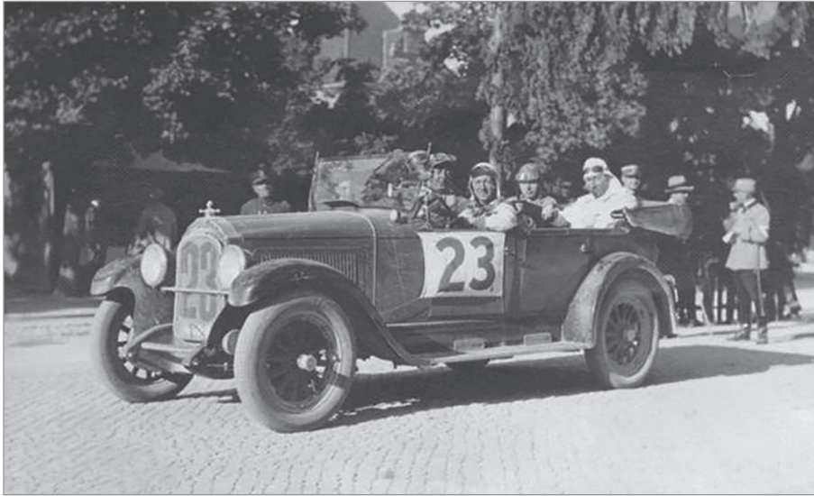
Automobilismul, un alt prilej de distracție apărut după 1918. Imagine de la una dintre cursele automobilistice din anii 1930.