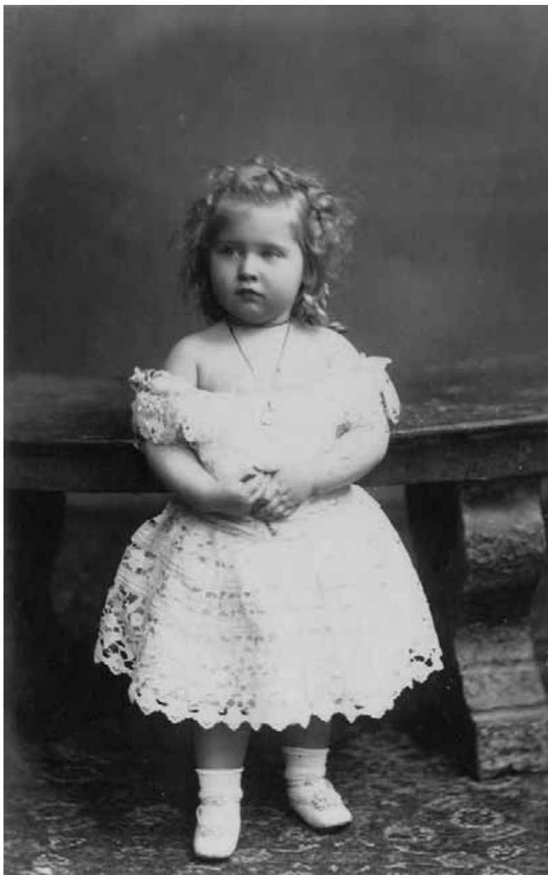
Mica principesă fotografiată de Franz Mandy.