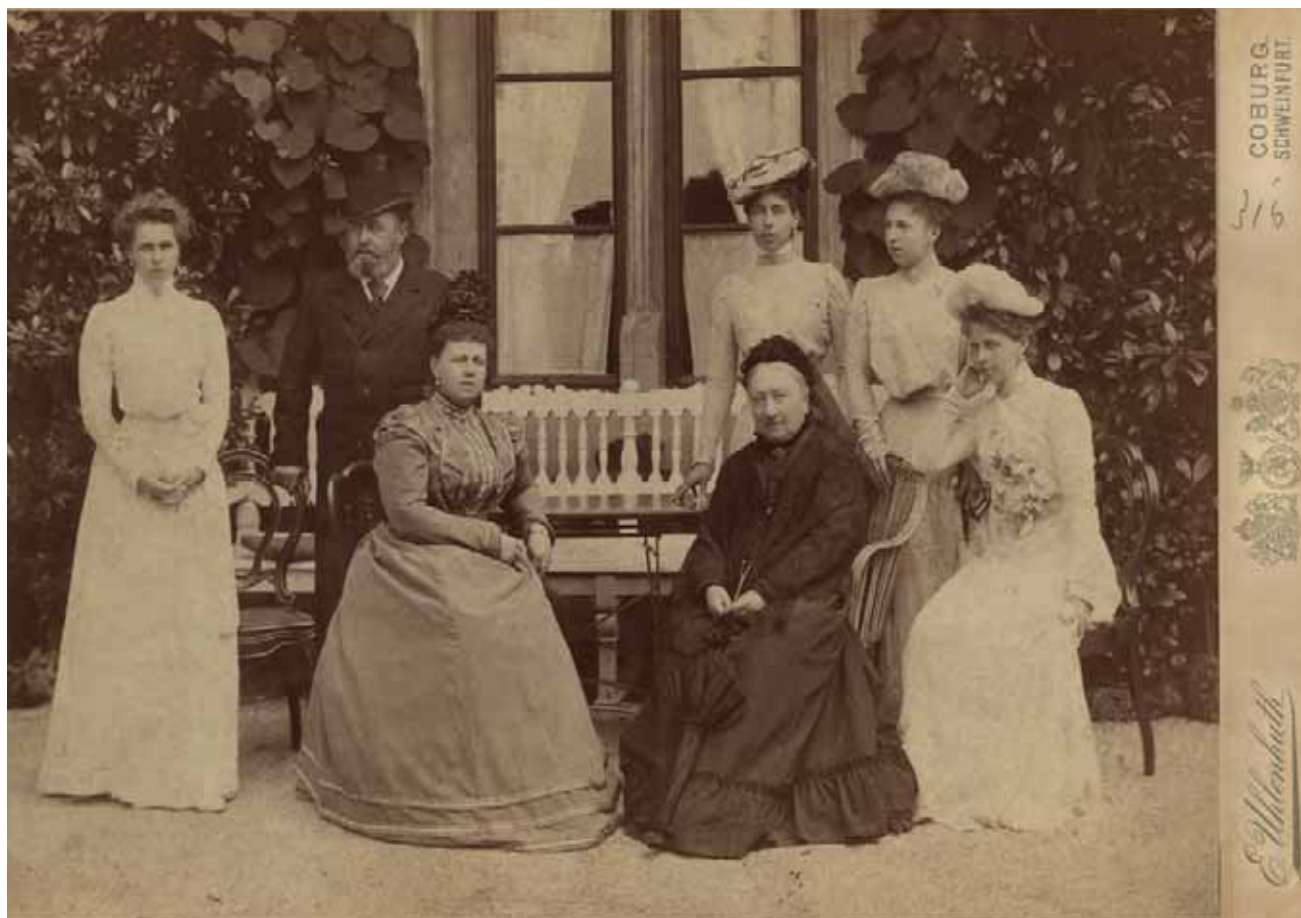
Veche reuniune de familie la Coburg: Principesa Beatrice, Ducele și Ducesa de Saxa-Coburg-Gotha, Alexandrina de Saxa-Coburg-Gotha, Principesa Maria a României, Principesele Victoria Melita și Alexandra.