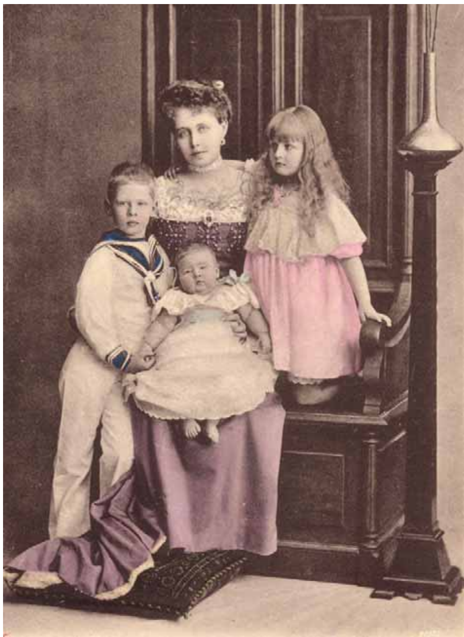
Principesa moștenitoare a României cu Mignon, Carol și Elisabeta.