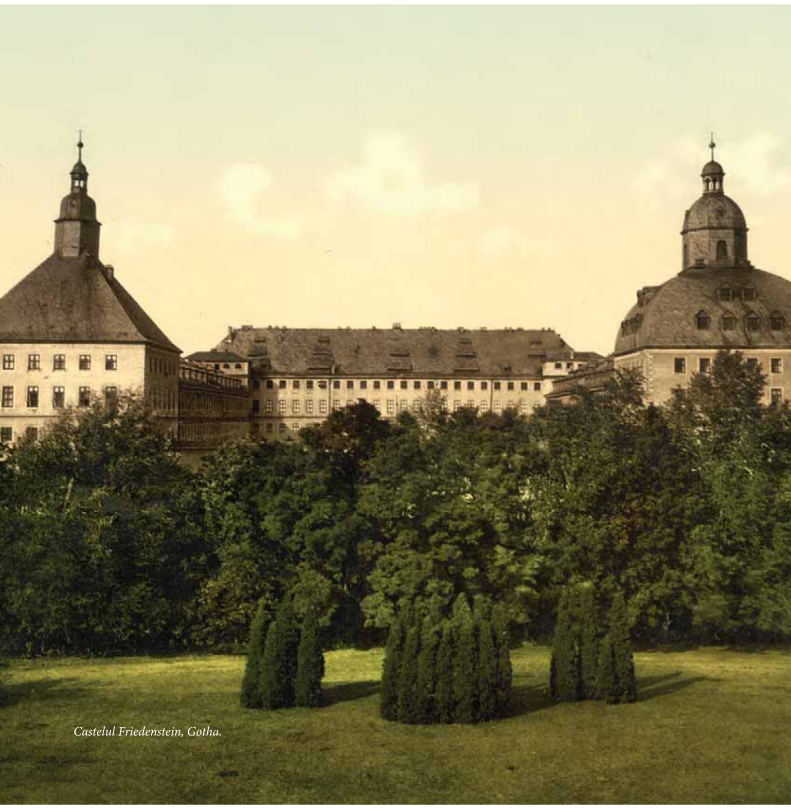
Castelul Friedenstein, Gotha.