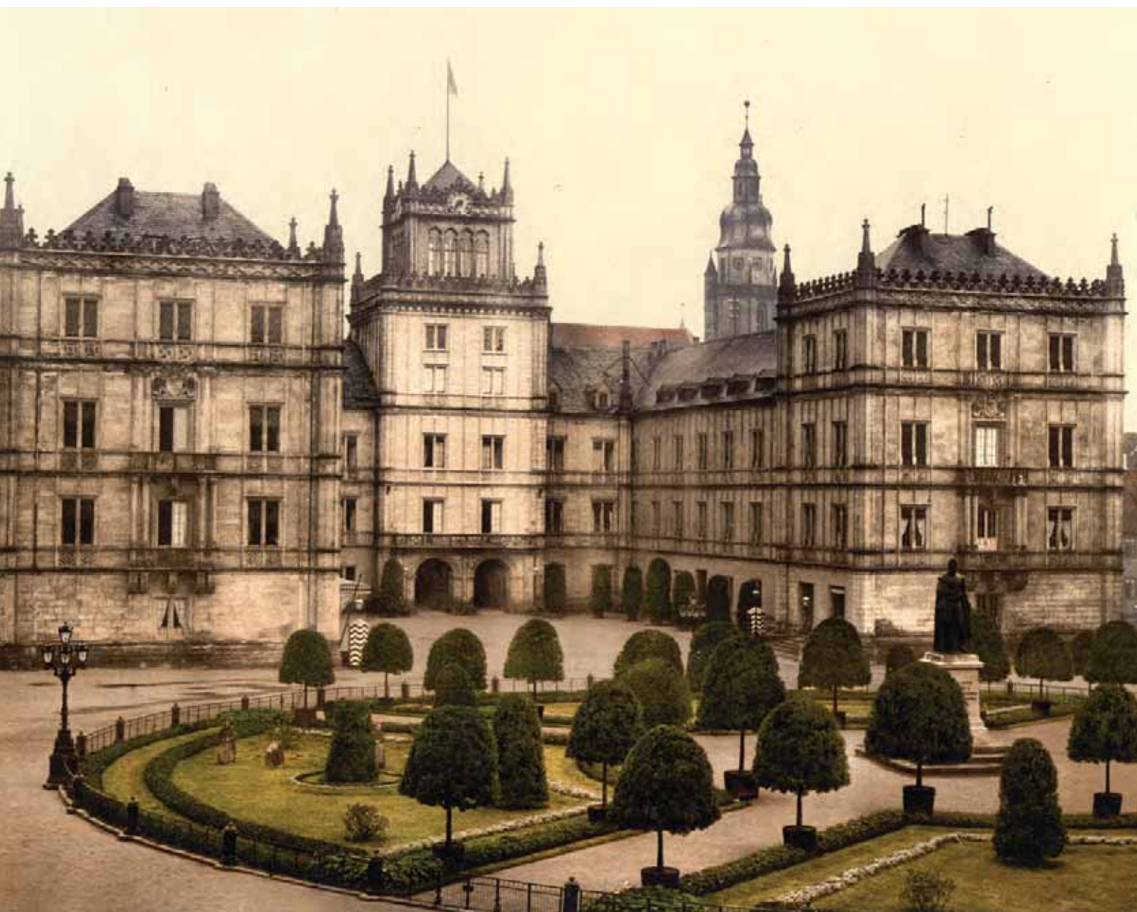
Castelul Ehrenburg, Coburg.