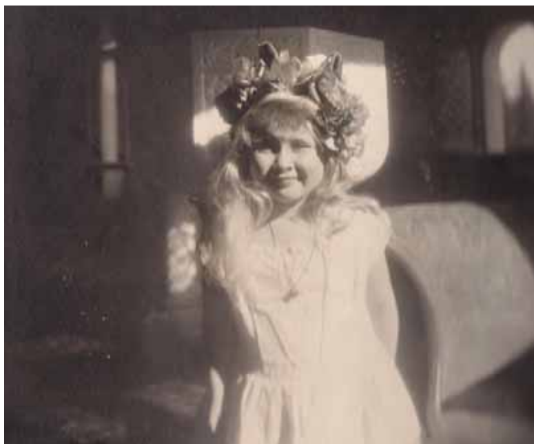
Mignon, fotografie de familie.