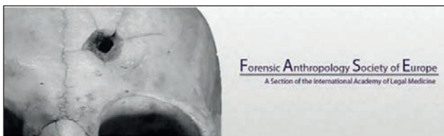
FIGURA 3. FASE – Forensic Anthropology Society of Europe

IOFOS – International Organization for Forensic Odonto-Stomatology – are un program de asigurare a calității examinărilor odontostomatologice medico-legale pe diferite activități (precum identificarea vârstei pe baza dentiției sau evaluarea leziunilor traumatiche dentare), permițând armonizarea practicii odontostomatologice medico-legale la nivel internațional [7].