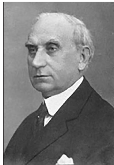
FIGURA 1 Mina Minovici

După Mina Minovici, medicina legală este „știința ale cărei principii contribuie la desăvârșirea legilor având ca obiectiv păstrarea structurii morale a societății și ale cărei demonstrații, în ceea ce privește actele omului fizic și moral,