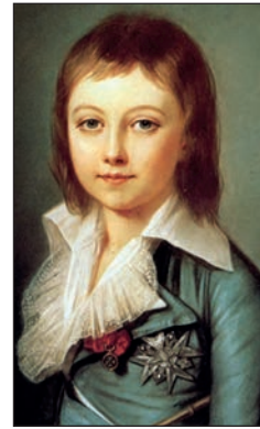
FIGURA 5. Ludovic al XVII-lea, pictură, Alexander Kucharski

individ de 15-16 ani, deoarece au fost identificați toți cei 28 de dinți permanenți, precum și molarii trei. Estimarea vârstei realizată de Dr. Recamier a fost considerată corectă, iar rămășițele au fost îngropate într-un mormânt anonimizat. În 1897, o rudă a lui Ludovic al XVII-lea a primit permisiunea de a căuta din nou mormântul acestuia. A identificat un nou sicriu, care adăpostea scheletul unui tânăr de sex masculin. Tot pe baza gradului de dezvoltare dentară, experții au decis că acele rămășițe nu erau ale lui Ludovic, vârsta estimată fiind de minimum 16 ani. Acest caz reprezintă unul dintre primele în care s-a încercat estimarea vârstei pe baza danturii [15].