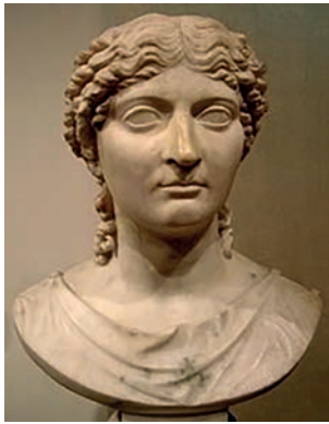
FIGURA 4. Agrippina, Muzeul Național din Varșovia

făcută pe baza unui dinte colorat anormal sau a unei malocluzii [10].