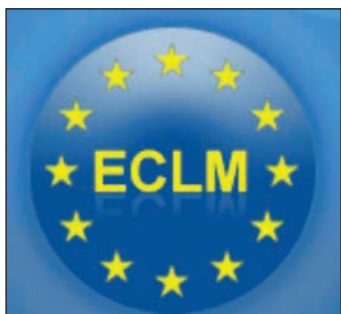
FIGURA 2. Logo-ul Consiliului European de Medicină Legală

Medicina legală odontostomatologică sau odontostomatologia medico-legală este o subdisciplină a medicinei legale, aflată la interfața cu medicina dentară, ce încearcă să utilizeze cunoștințe specifice medico-dentare în spețe juridice (civile sau penale). Aici sunt incluse identificarea dentară, traumatologia dentară, estimarea vârstei, analiza mușcăturii, malpraxisul dentar, antropologia dentară, arheologia dentară etc. [4]