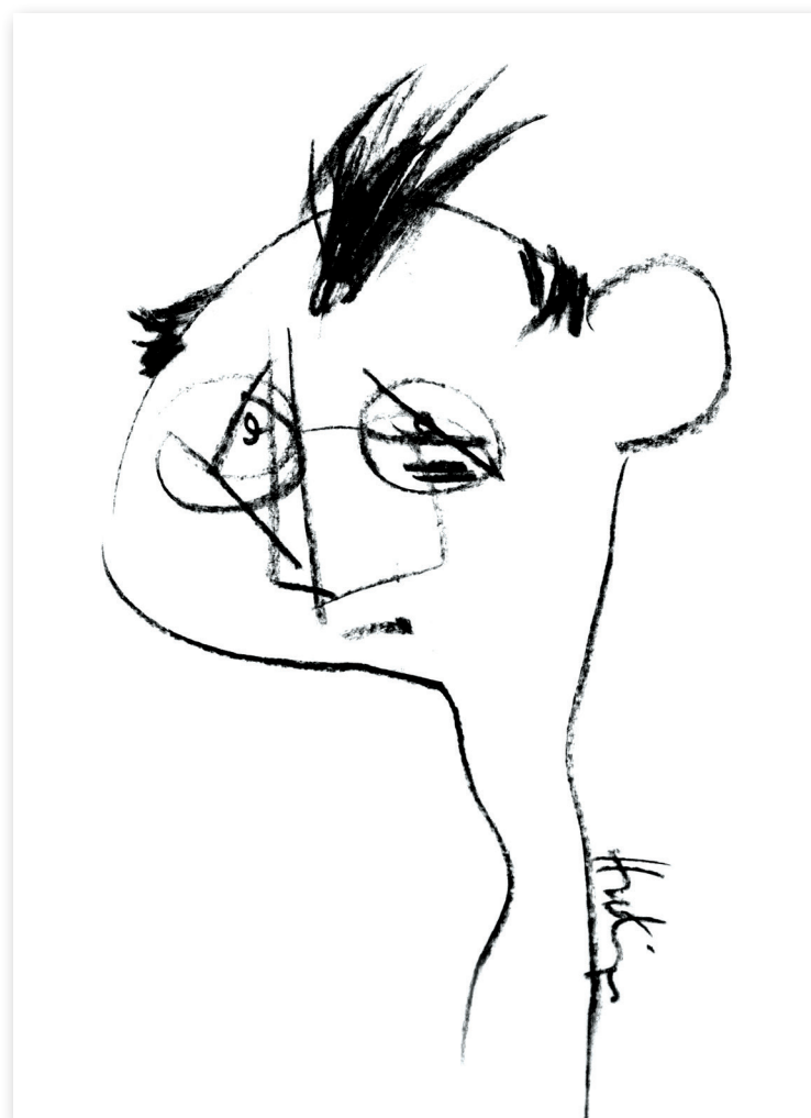
Autoportret II , 2005 Cărbune pe hârtie, 21 x 30 Colecție privată