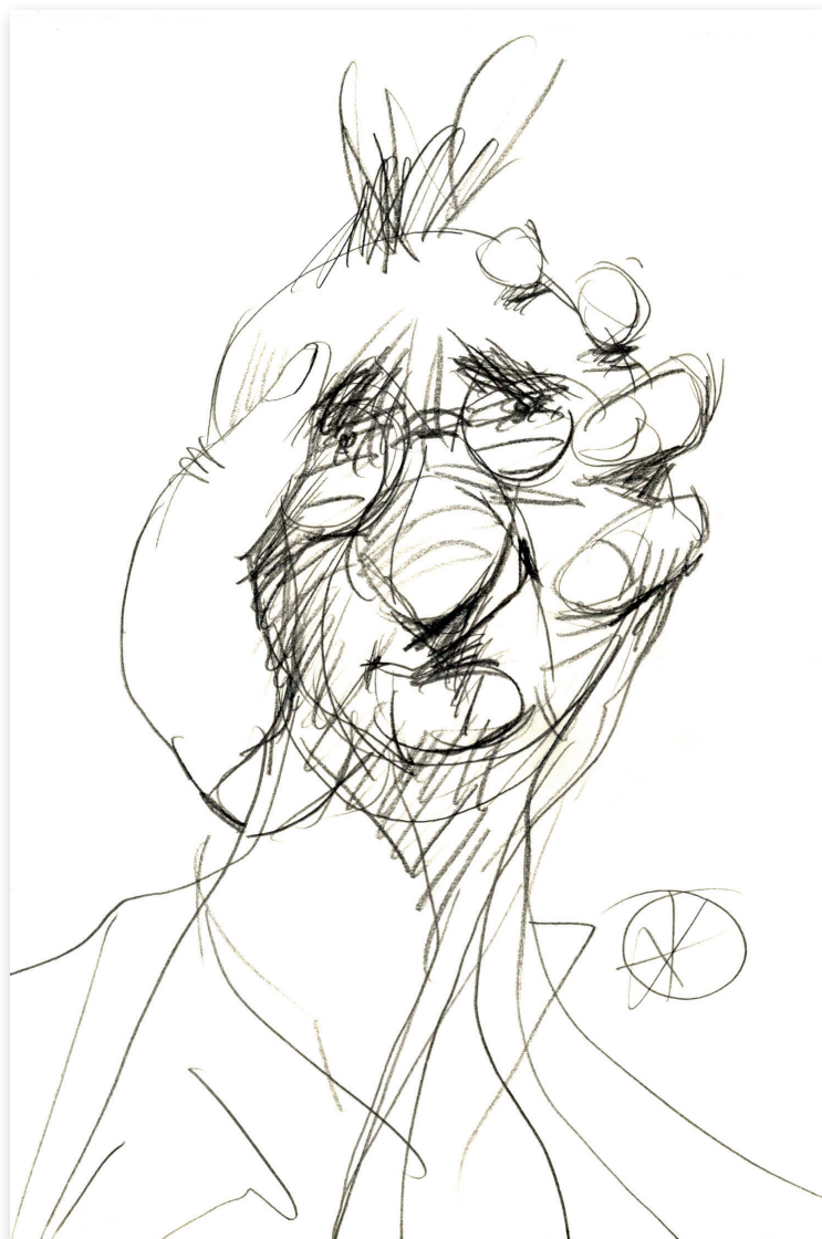
Schiță pentru un eventual autoportret , 2014 Creion pe hârtie, 21 x 30 Colecție privată