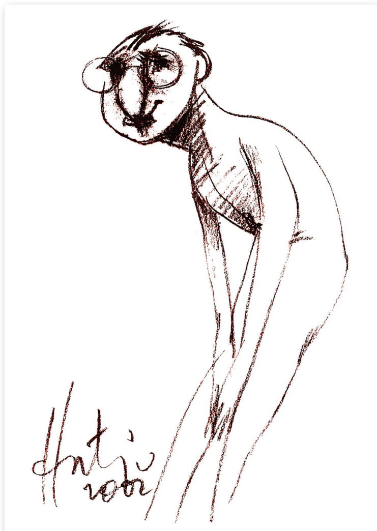
Timiditate , 2002 Cărbune pe hârtie, 21 x 30 Colecția Adi Garfunkel