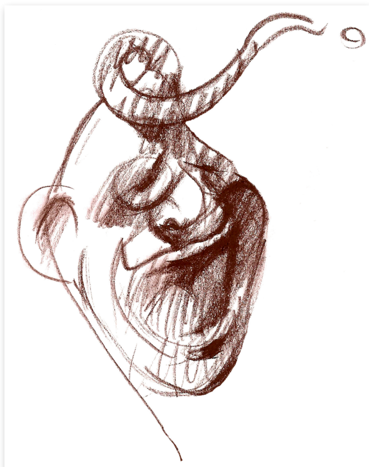
Autoportret I , 2005 Cărbune pe hârtie, 21 x 30 Colecție privată