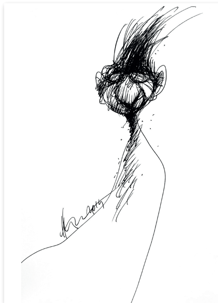
Ego , 2006 Tuș pe hârtie, 21 x 30 Colecție privată