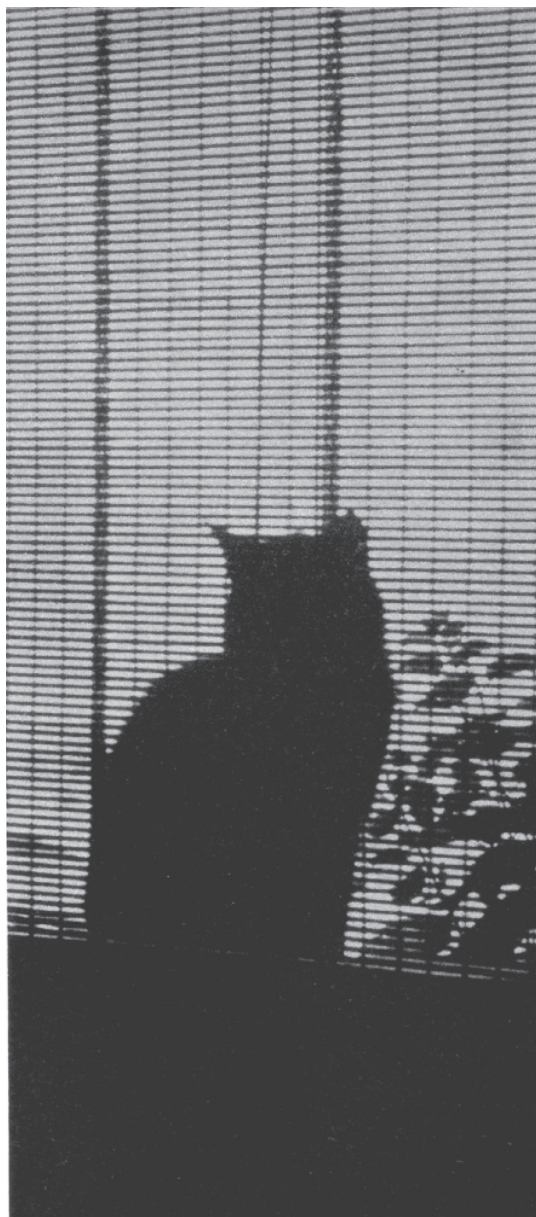
THEODOR W. ADORNO