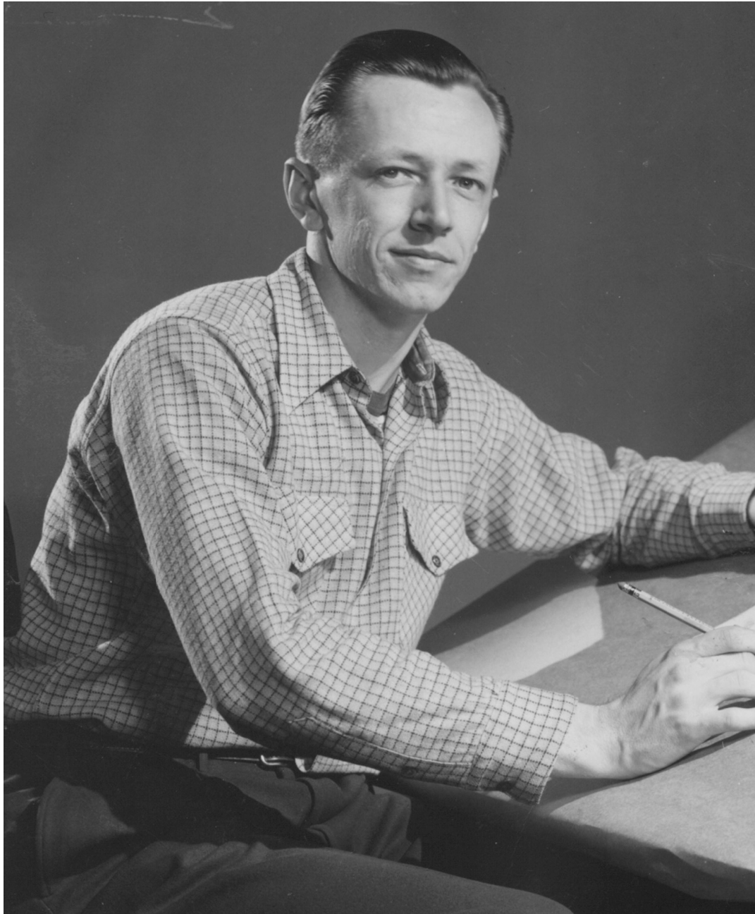
Charles Schulz circa 1950