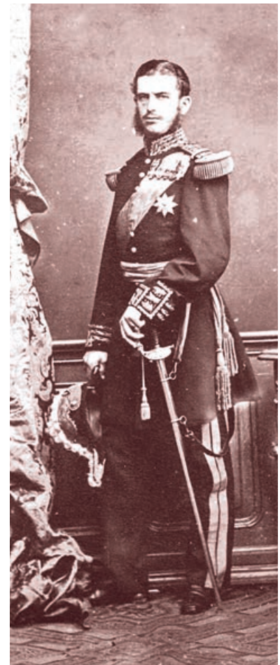
Carol Popp de Szathmári, Domnitorul Carol I al României , 1866, Biblioteca Academiei Române, Cabinetul de stampe, București, cota F I 224 074.

Mărind terenul cu o danie de la Ioan Vodă Caragea, Golescu își construiește în răstimp de trei ani, cu modestia caracteristică începuturilor dificile unei societăți ale cărei referințe intelectuale erau predominant fanariot-orientale, în care arhitectura, pictura și celelalte arte erau puțin apreciate, o nouă casă, unul dintre primele edificii în stil neoclasic ale Bucureștilor. Casa devine prin amploare un reper al Capitalei acelor vremi. O legendă spune chiar că Radu Golescu ar fi exclamat: „Frumos salon, fătul meu! Dar cu ce o să-l luminezi?” 5 La care acesta, plin de entuziasm vizionar, ar fi răspuns: „Tată, eu