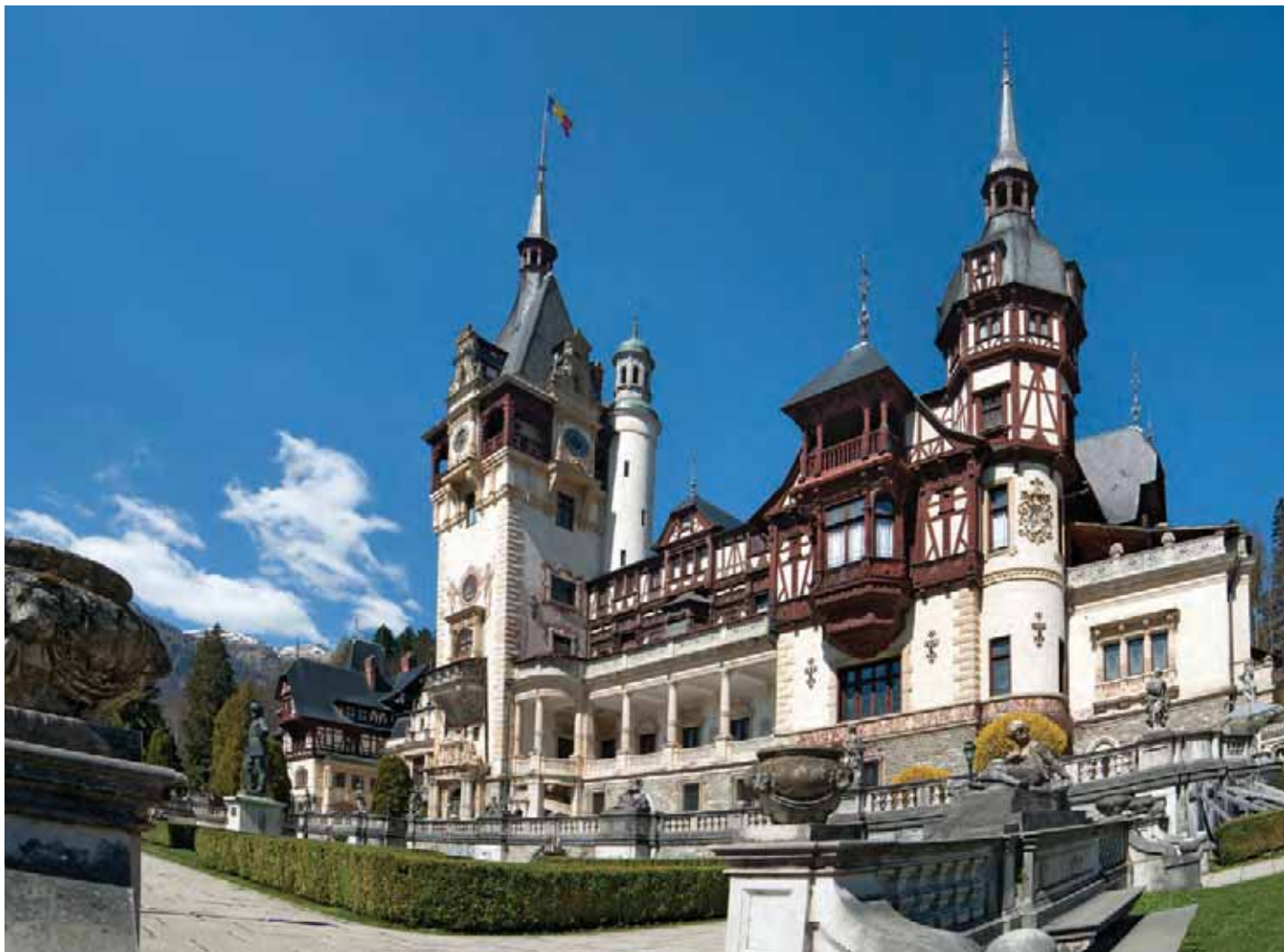
Castelul Peleş, vedere generală.