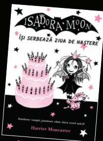
Își serbează ziua de naștere