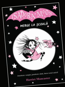
Merge la școală

De la frigerea bezelelor pe un foc de tabără, la împrietenirea cu o sirenă – în preajma Isadorei se petrec lucruri speciale!