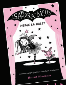
Merge la balet