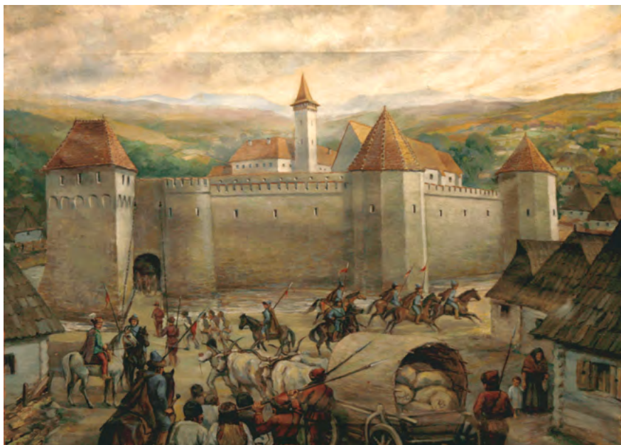
Rezső Haáz, Cetatea Székely Tümadt în secolul al XVI-lea. Muzeul „Haáz Rezső”, Odorheiu Secuiesc. (În epoca în care a fost pictat tabloul, cetatea nu mai arăta astfel.)