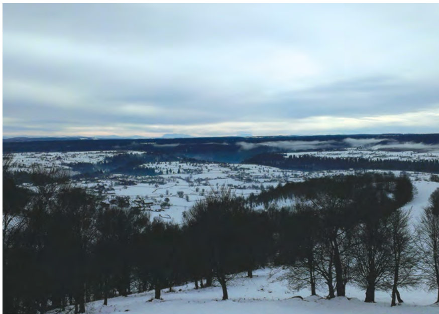
Vârşag, aşezare montană de pe platoul Harghitei.