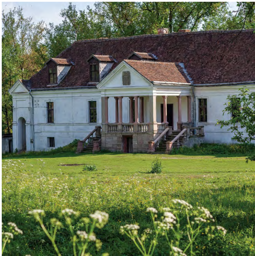
Conacul Kálnoky din Micloșoara, secolele XVII–XIX, Trei Scaune, județul Covasna.