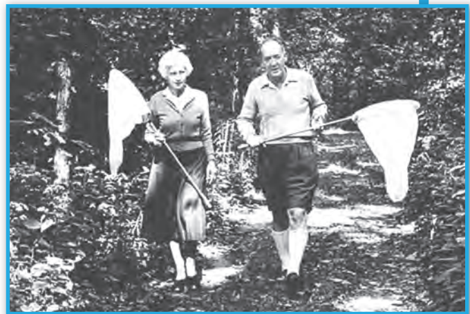
Vladimir Nabokov și soția sa Vera în căutare de fluturi

... deși s-a consacrat ca romancier, Nabokov nu și-a abandonat niciodată pasiunea din copilărie, înregistrând, alături de soția sa, sute de specii de fluturi și făcând chiar descoperiri științifice?