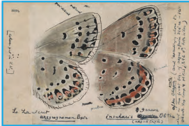
Ilustrație științifică realizată de Vladimir Nabokov

mereu cu mostre halucinante ale unor caractere mici de litere: „... singurul specimen cunoscut până acum...”, „... unicul specimen de Eupithecia petropolitana a fost prins de un școlar rus...”, „... de un tânăr colecționar rus”, „... de mine însumi în provincia St. Petersburg, districtul Țarscoe Selo, în 1910... 1911... 1912... 1913...” [...]