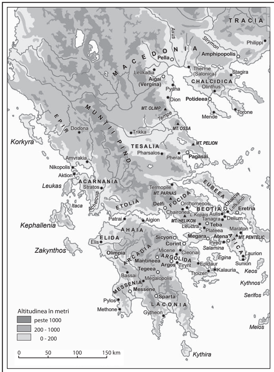
Figura 1 Harta Greciei și a lumii egeene