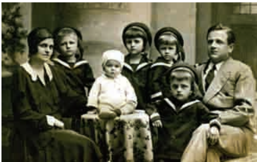
Așa arăta o familie în anii 1930 — și acesta este un izvor istoric.

Izvoarele sunt cercetate de istorici, care studiază cu atenție fiecare sursă pentru a vedea ce se poate învăța din ea. Acești specialiști se străduiesc să obțină cât mai multe informații din sursele istorice. De aceea, ei trebuie să afle cine, când și cu ce scop a realizat acea sursă. De asemenea, istoricii caută mai multe dovezi referitoare la același eveniment și verifică o sursă prin intermediul alteia.