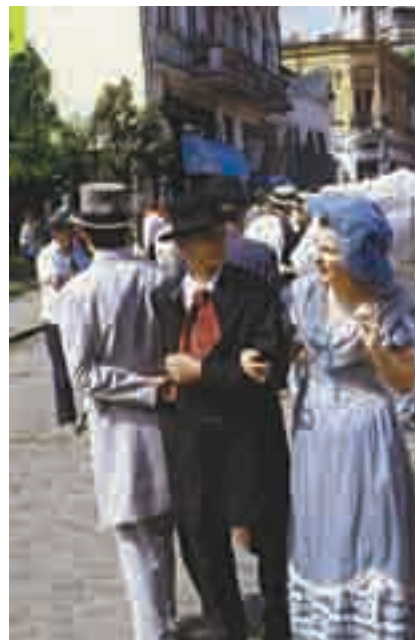
Carnaval pe străzile Bucureștiului

monument istoric — construcție importantă ca vechime sau frumusețe și care este apărută prin lege.