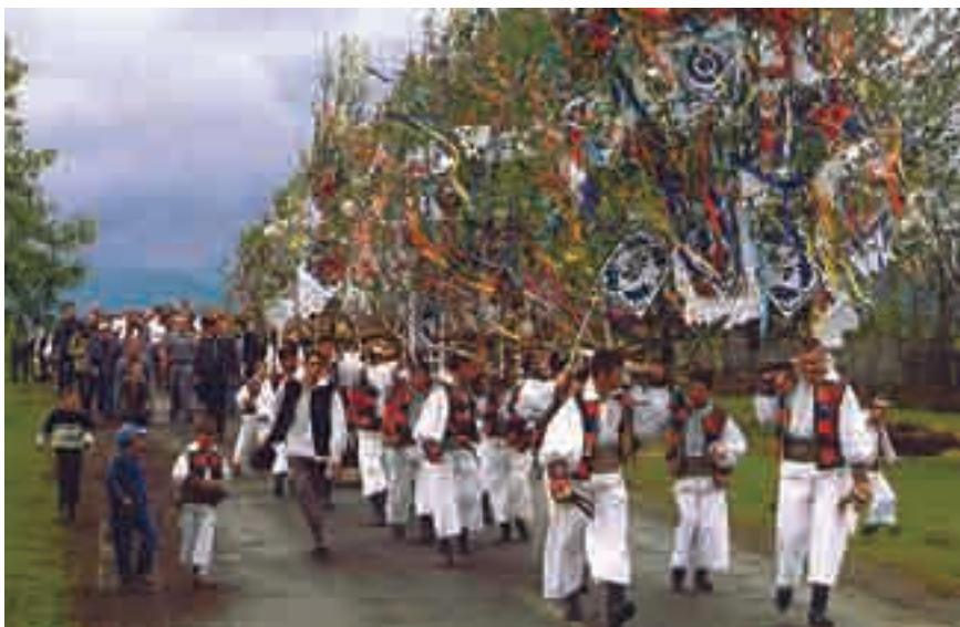
Tot satul participă la sărbători