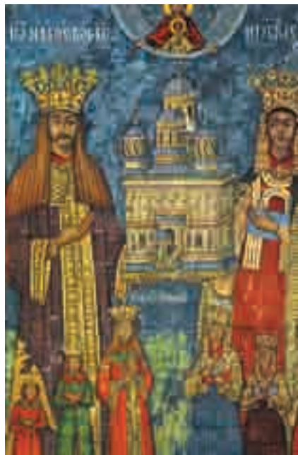
Domnitorul Neagoe Basarab cu familia sa (Mănăstirea Curtea de Argeș)