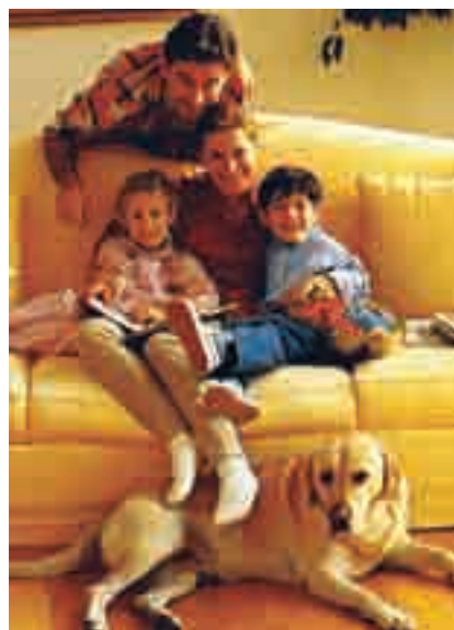
O familie din zilele noastre