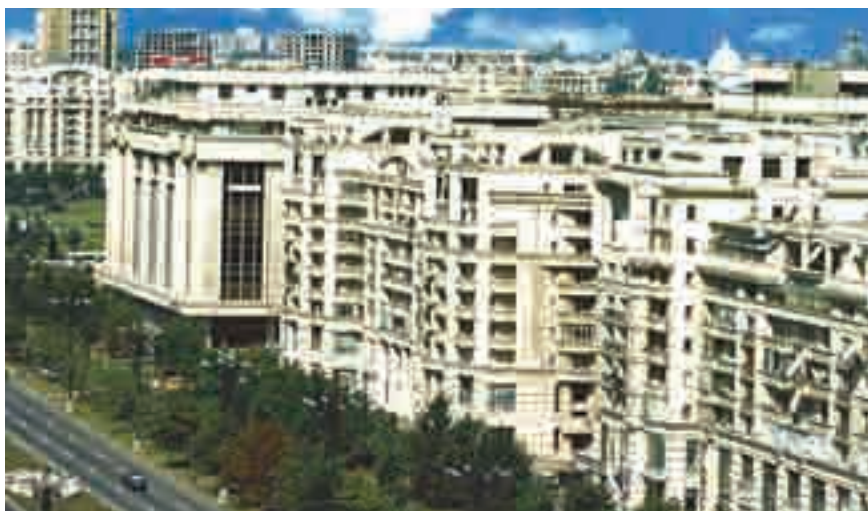
În oraș, oamenii locuiesc mai ales în blocuri.

L ocalitatea natală este familia mai mare în care trăim. Indiferent că aceasta este un oraș dezvoltat sau un sat foarte mic, pentru noi este la fel de important să aflăm care sunt ocupațiile și obiceiurile locuitorilor, prin ce s-au remarcat aceștia; cum s-a schimbat înfățișarea oamenilor și a locurilor de-a lungul timpului. Toate acestea ne ajută să cunoaștem istoria comunității noastre.