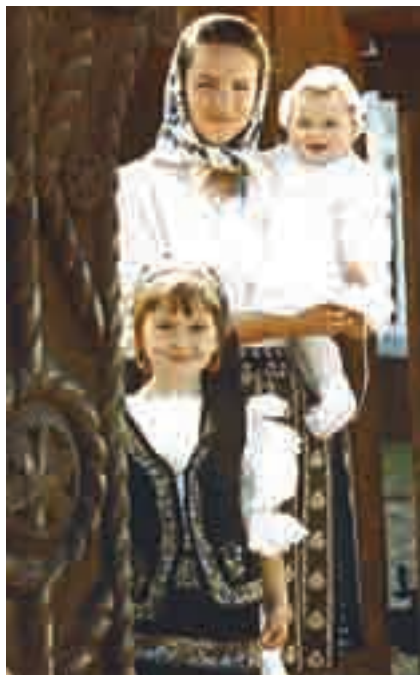
În sat, oamenii își păstrează obiceiurile.