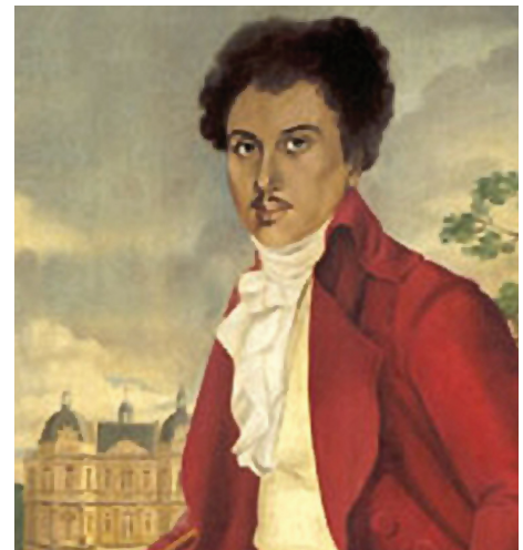
Alexandre Dumas (1802–1870)

— Mais non, repond Dumas, c'est le spectateur d'hier qui ne s'est pas encore reveille.