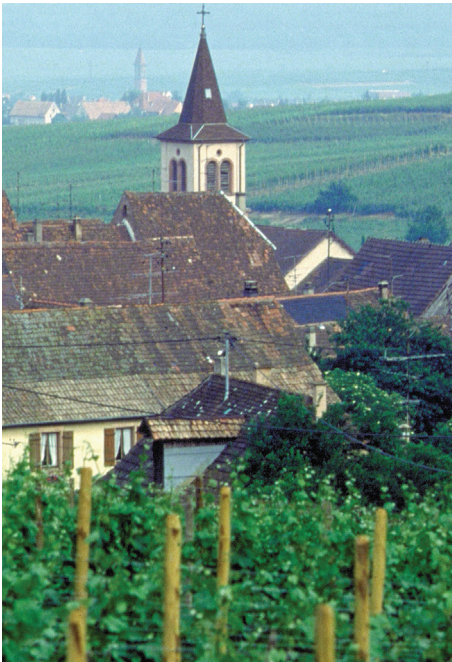
Les vignes, un véritable patrimoine français.

(à + le) Il parle au garçon. (à + les) Il offre des cadeaux aux enfants. (de + le) C'est le stylo du professeur. (de + les) Les cahiers des élèves sont propres.